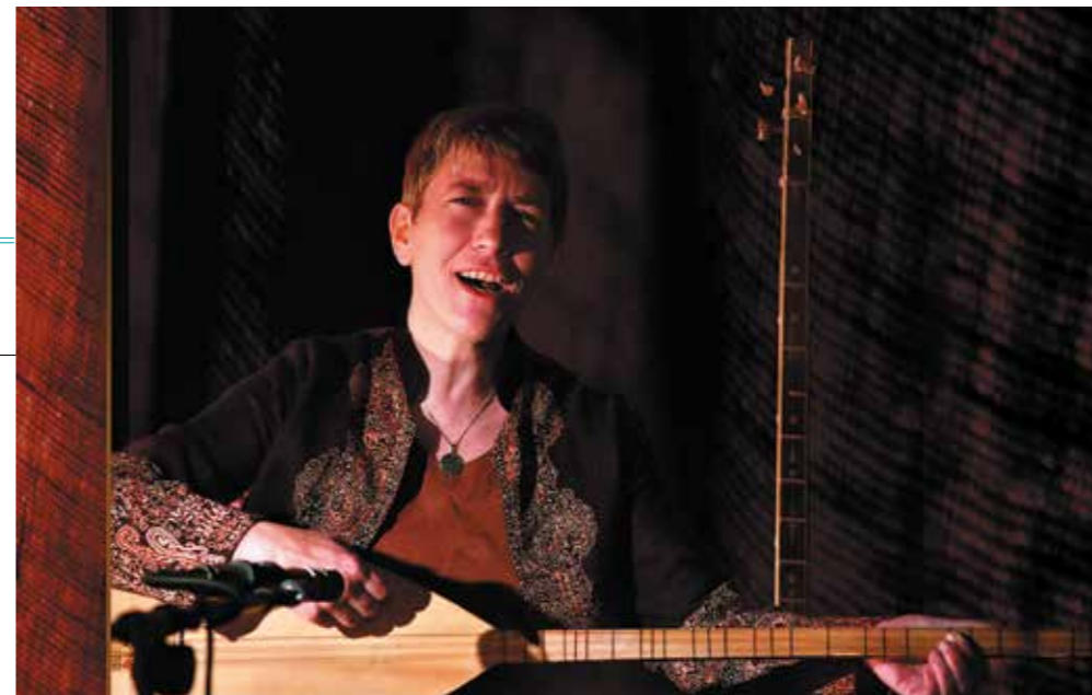
Affiche La muraille et le vent © Pierre Diene