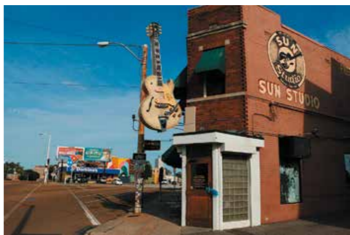
© Claude Humbert, Arnaud Epagneau-Comte, Florian Coupé